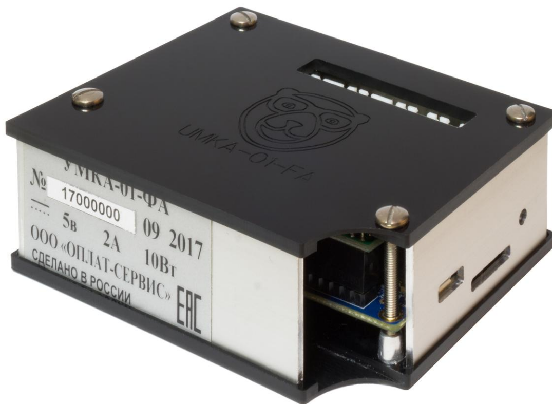
Рисунок 1: ККТ УМКА-01-ФА Общий вид

ФН устанавливается внутрь корпуса ККТ, подробнее об установке ФН см. УМКА-01-ФА Инструкция по установке и замене фискального накопителя.